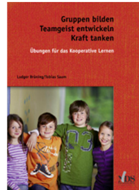
Gruppen bilden, Teamgeist entwickeln, Kraft tanken

Alle vier Bücher sind erschienen im Verlag Neue Deutsch Schule, Essen