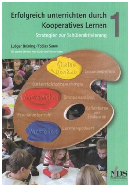
Erfolgreich unterrichten durch Kooperatives Lernen Band 1