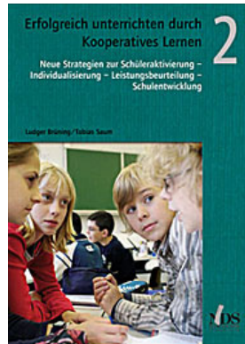
Erfolgreich unterrichten durch Kooperatives Lernen Band 2